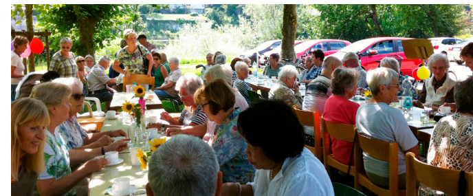
Kaffee und Kuchen beim Bädle-Treff