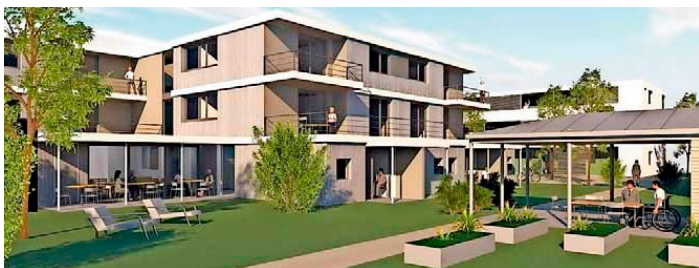
Entwurf der barrierefreien Wohnanlagen